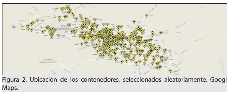
Figura 2. Ubicación de los contenedores, seleccionados aleatoriamente. Google Maps.

Se consideró la creación de una nueva capa en Google Maps para la ubicación de estos puntos (Figura 2) y se colocó en el enlace https://drive.google.com/open?id=1Ag-5xPQIxcLsRTd33tUPD0eKdII&usp=sharing