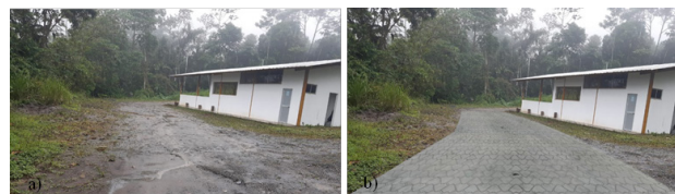
Figura 4. Vista panorámica de la mejora de las vías peatonales, sector del comedor. a) vía lastrada, b) vía con la implementación de adoquines de relave.

Uno de los objetivos de la empresa para el empleo de los relaves como agregado en la fabricación de adoquines, es usar estos elementos de apoyo en la mejora de las vías que son parte del campamento. Finalmente, en la Figura 4 se muestra la aplicación de los adoquines en la mejora en la red vial de tránsito peatonal en el interior del predio donde se desarrolla la mina. El área a intervenir con el uso de adoquines de relave es de 3 311 m 2 , lo que equivale al evacuar una piscina de las 15 existentes en la empresa minera. En las siguientes figuras se observa la mejora que tendrían las vías.