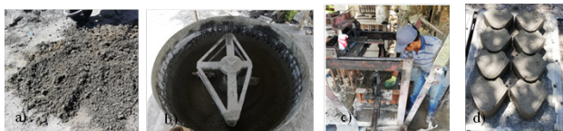
Figura 3. a) Secado natural del relave, b) Dosificación en la mezcladora, c) Vibro-prensado en moldes personalizados de adoquines, d) Secado al aire libre de los adoquines.

Uno de los objetivos de la empresa para el empleo de los relaves como agregado en la fabricación de adoquines, es usar estos elementos de apoyo en la mejora de las vías que son parte del campamento. Finalmente, en la Figura 4 se muestra la aplicación de los adoquines en la mejora en la red vial de tránsito peatonal en el interior del predio donde se desarrolla la mina. El área a intervenir con el uso de adoquines de relave es de 3 311 m 2 , lo que equivale al evacuar una piscina de las 15 existentes en la empresa minera. En las siguientes figuras se observa la mejora que tendrían las vías.