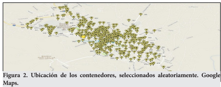
Figura 2. Ubicación de los contenedores, seleccionados aleatoriamente. Google Maps.

Se consideró la creación de una nueva capa en Google Maps para la ubicación de estos puntos (Figura 2) y se colocó en el enlace https://drive.google.com/open?id=1Ag-5xPQIxcLsRTd33tUPD0eKdII&usp=sharing